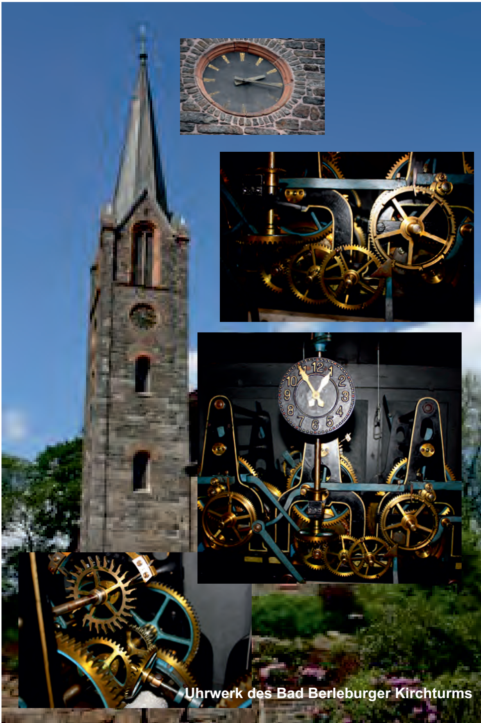
Uhrwerk des Bad Berleburger Kirchturms